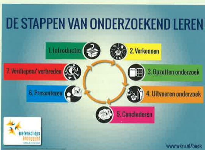
De stappen van onderzoekend leren.