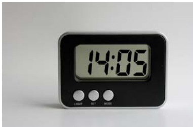
Wekker die op een bepaalde tijd een geluid laat horen om je wakker te maken