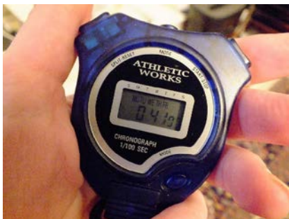
Stopwatch die aangeeft hoeveel tijd er verstreken is