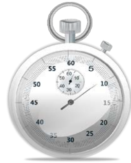
Time timer, een apparaat wat een bepaald aantal minuten aftelt en een geluid laat horen wanneer de tijd voorbij is