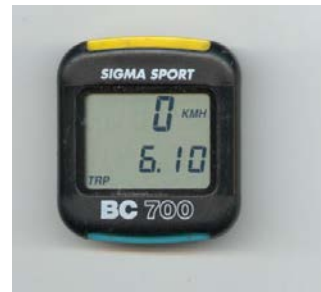
Fietscomputer die aangeeft hoe hard je fietst