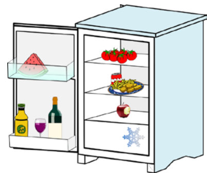
Koelkast die verbonden is met je mobiele telefoon zodat je in de winkel kunt zien wat er in zit