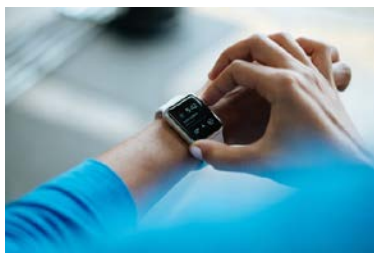
Smartwatch die je hartslag meet, hoeveel je hebt gerend en vooraf ingestelde contacten belt als je valt

wetenschapsknooppunt Radboud Universiteit